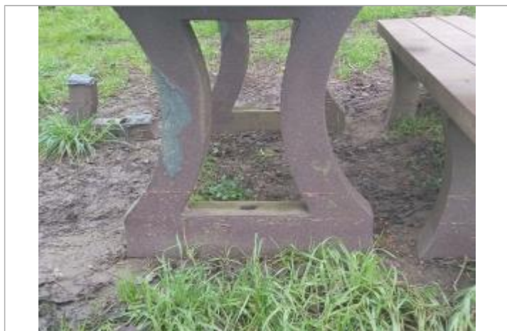
laisses de crue observées

Maximum de l'inondation : Oui Visibilité : Oui État du repère : Moyen