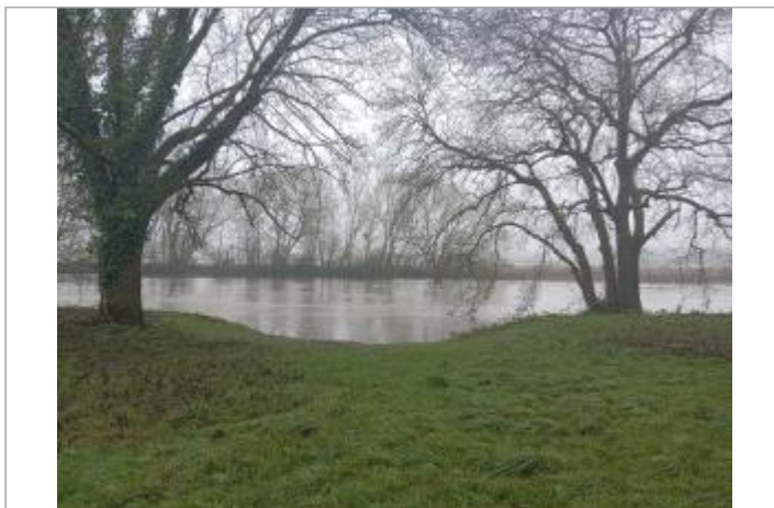
site à proximité de la Sarthe