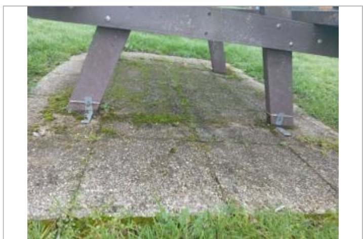
Marque à la peinture blanche sur table de pique-nique

GÉNÉRAL Code : WEB_R_202503114322 Date de mise à jour : 18/03/2025 Auteur : RDI-DDT72