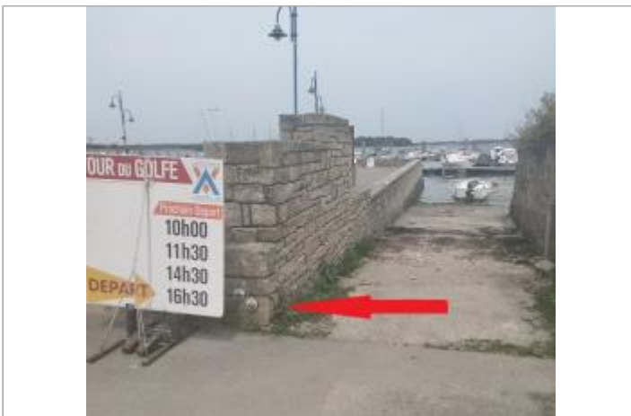
Muret quai Gerry Roufs le 29 mai 2026

GÉOLOCALISATION Coordonnées WGS84 : X: -2.94316401 / Y: 47.56933090 Coordonnées RGF93 (Lambert 93) X: 253581.51 / Y: 6735580.79 Coordonnées RGF93 (ETRS89) : X: -2.943164 / Y: 47.5693309 Code Hydro: _OATLANT Rive de référence: