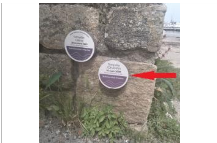
Repère de Submersion marine de la tempête Johanna du 10 mars 2008

MARQUE Texte : Tempête JOHANNA - 10 mars 2008 - Submersion marine Maximum de l'inondation : Oui Visibilité : Oui État du repère : Bon Pérennité : Longue Repère calculé : Non PHEC : Oui