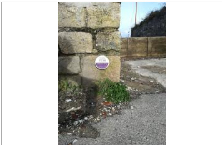
Repère de Submersion marine de la tempête Johanna du 10 mars 2008

MARQUE Texte : Tempête JOHANNA - 10 mars 2008 - Submersion marine Maximum de l'inondation : Oui Visibilité : Oui État du repère : Bon Pérennité : Longue Repère calculé : Non PHEC : Oui