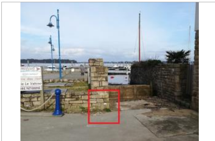
Muret quai Gerry Roufs

GÉOLOCALISATION Coordonnées WGS84 : X: -2.94316401 / Y: 47.56933090 Coordonnées RGF93 (Lambert 93) X: 253581.51 / Y: 6735580.79 Coordonnées RGF93 (ETRS89) : X: -2.943164 / Y: 47.5693309 Code Hydro: _OATLANT Rive de référence: