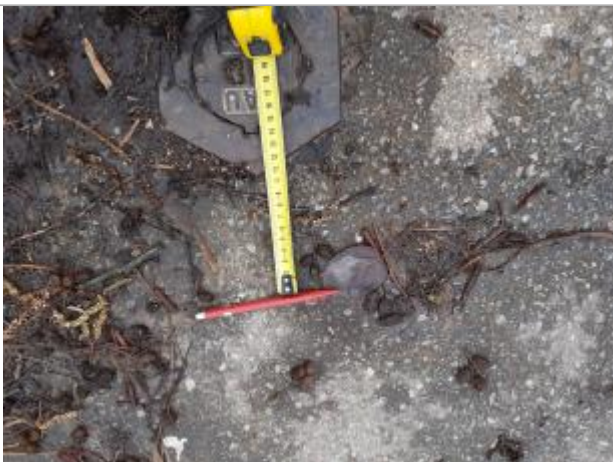
Laisse de crue au sol, à 10 cm de la bouche à clé

SOURCE DE REPÉRAGE : RELEVÉ PHE CAEN LA MER SUITE CRUE DU 10/01/2025 - 10/01/0205