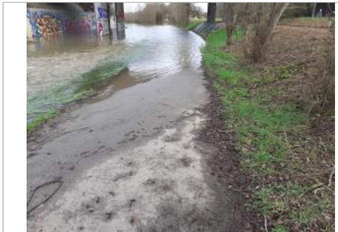
Prise de vue du site

Coordonnées WGS84 : X: -0.39480158 / Y: 49.13831860