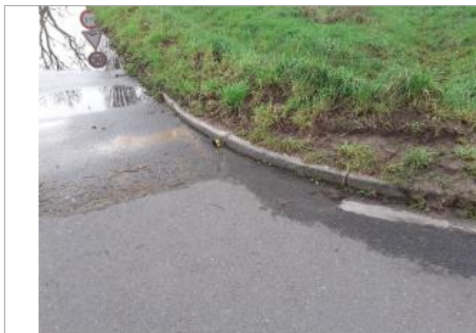
Prise de vue de la laisse de crue

Altitude calculée de l'eau (en m) : 5.19