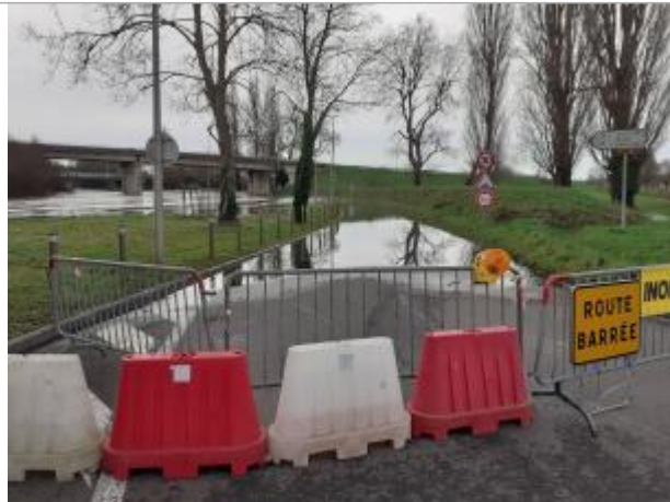
Prise de vue depuis Caen vers Louvigny