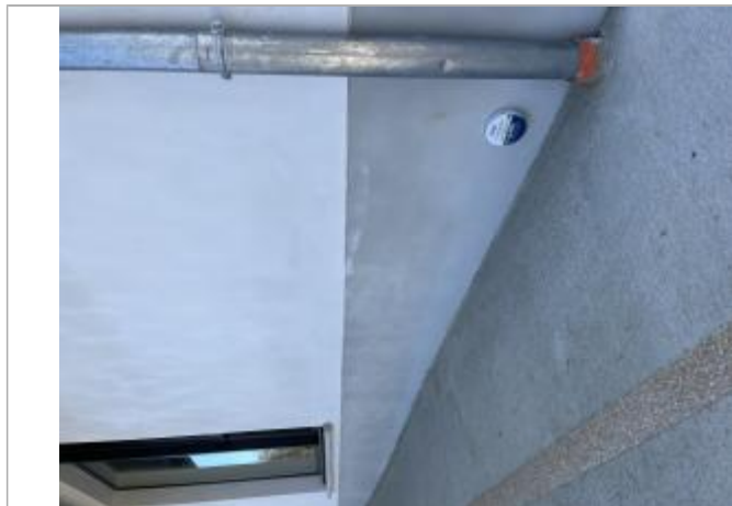
Repère - bâtiment à proximité du court de tennis

Altitude calculée de l'eau (en m) : 232.455 m