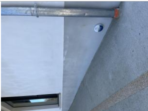
Repère - bâtiment à proximité du court de tennis

Altitude calculée de l'eau (en m) : 232.455 m