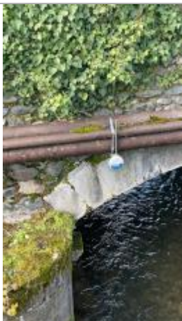
Repère - pont de Lée