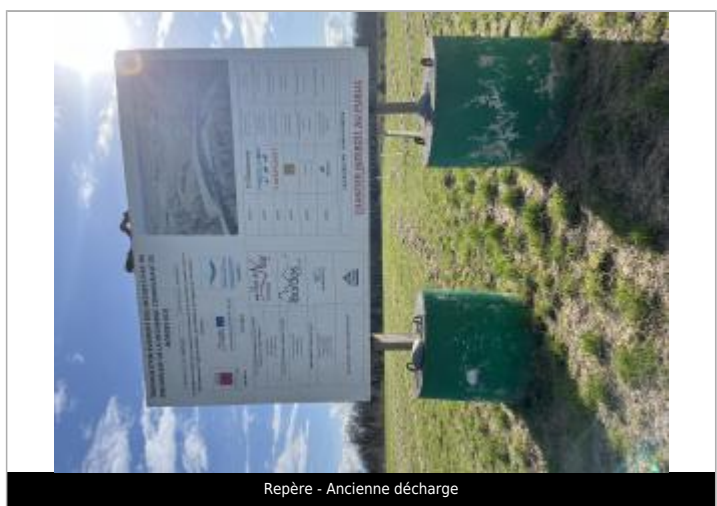
Repère - Ancienne décharge

MARQUE Texte : Crue 18 Juin 2013 ; Gave de Pau ; Niveau atteint par les eaux Visibilité : Oui