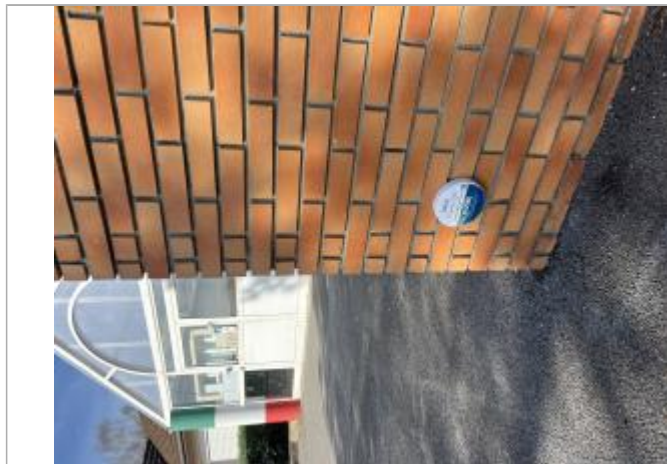
Repère - école d'Artigueloutan