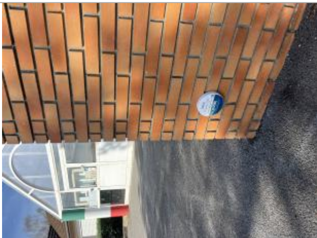
Repère - école d'Artigueloutan

Altitude calculée de l'eau (en m) : 245.56