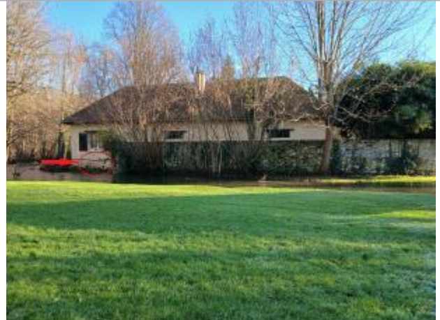
Vue depuis le lavoir.