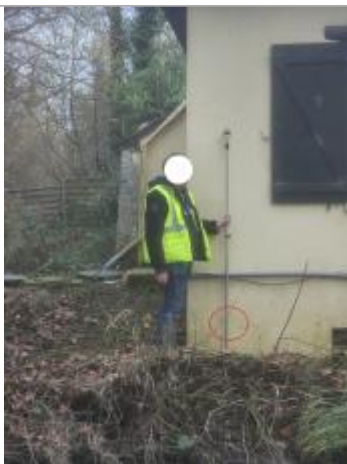
Laisse de crue à 28.5 cm/sol.

Altitude calculée de l'eau (en m) : 18.765 m