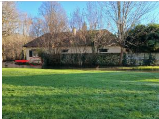
Vue depuis le lavoir.