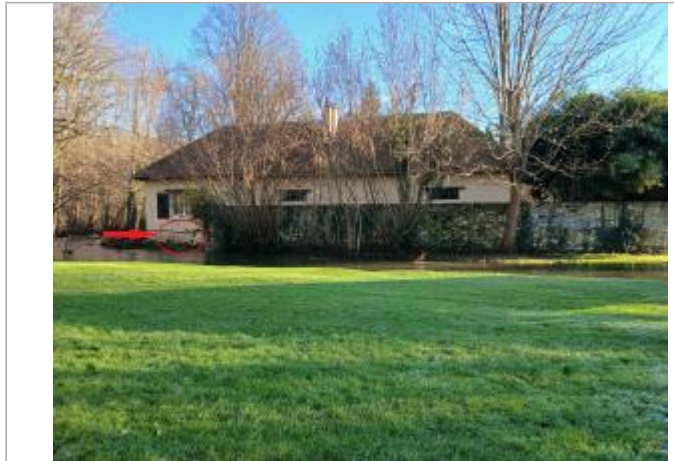
Vue depuis le lavoir.

Coordonnées WGS84 : X: 1.59014885 / Y: 49.07844430