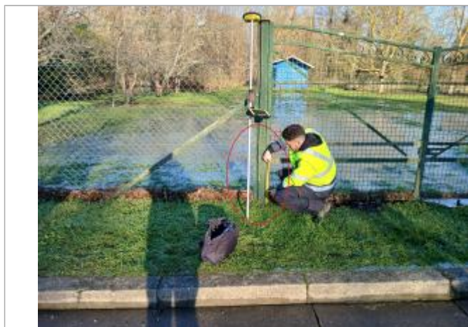
Laisse de crue à 20 cm/sol.

SOURCE DE REPÉRAGE : VISITE DE TERRAIN SPC SACN - 11/03/2020