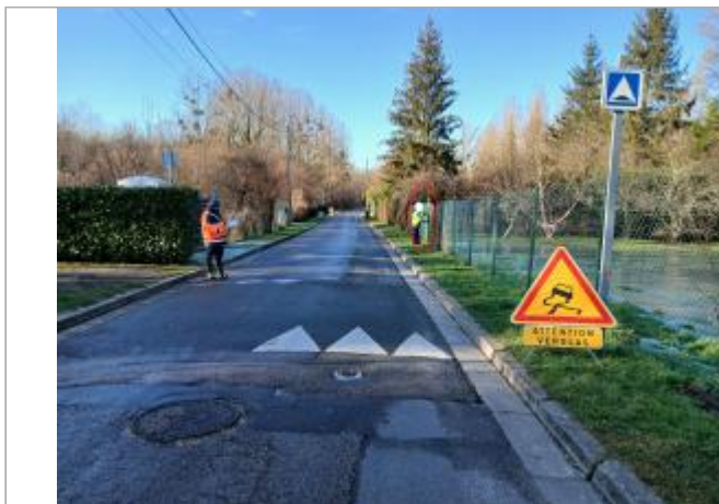
Vue depuis la rue de l'Eau.