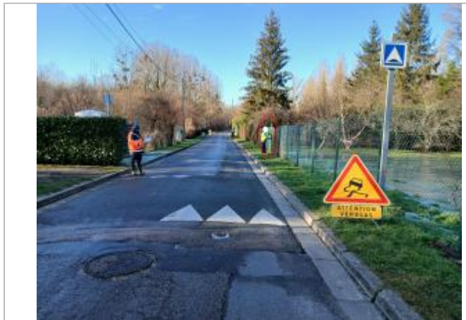
Vue depuis la rue de l'Eau.

Coordonnées WGS84 : X: 1.59071547 / Y: 49.07770770