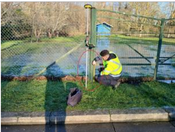
Laisse de crue à 20 cm/sol.

Altitude calculée de l'eau (en m) : 18.85