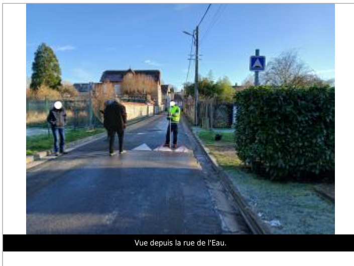
Vue depuis la rue de l'Eau.