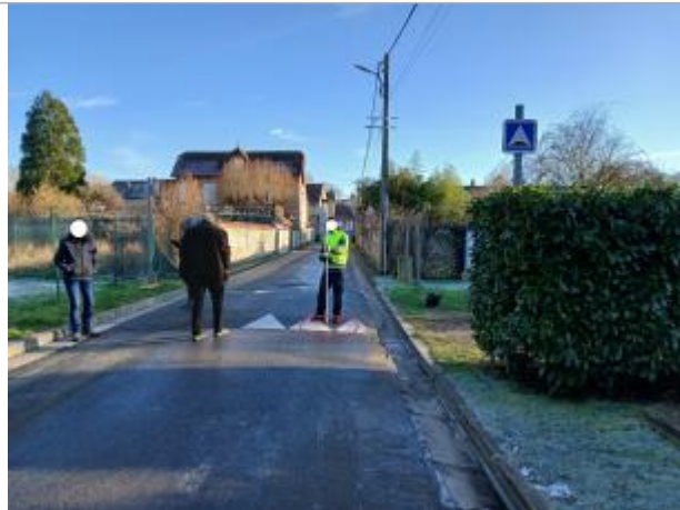
Vue depuis la rue de l'Eau.