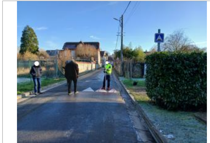
Vue depuis la rue de l'Eau.

Coordonnées WGS84 : X: 1.59080467 / Y: 49.07760750