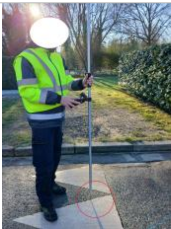
Laisse de crue au sol.