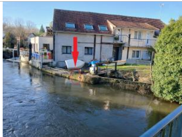
Vue depuis le pont de la rue de Paris