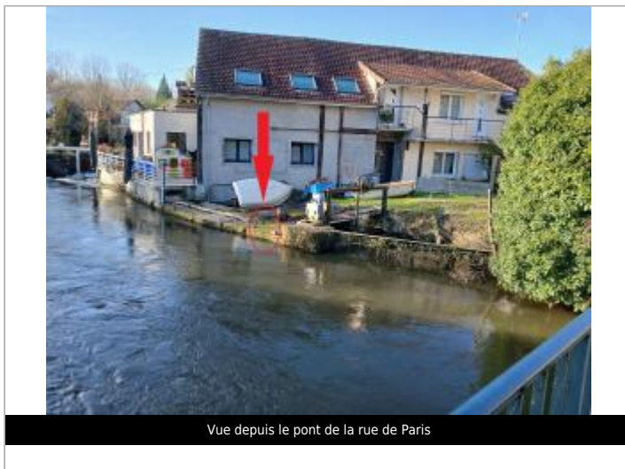
Vue depuis le pont de la rue de Paris