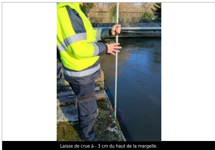
Laisse de crue à - 3 cm du haut de la margelle.