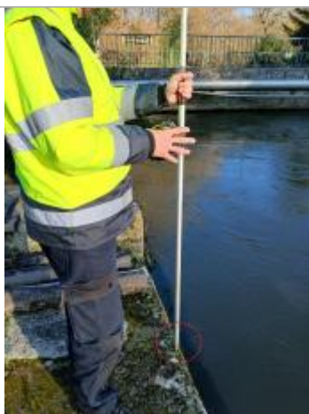
Laisse de crue à - 3 cm du haut de la margelle.

Altitude calculée de l'eau (en m) : 20.77