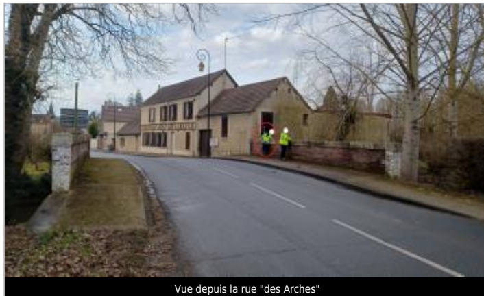
Vue depuis la rue "des Arches"