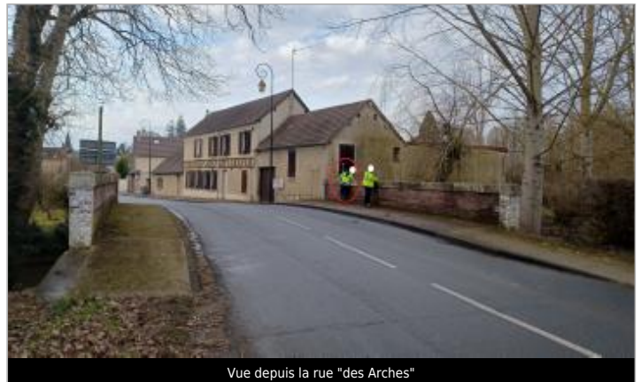
Vue depuis la rue "des Arches"

Coordonnées WGS84 : X: 1.60990212 / Y: 49.08657740