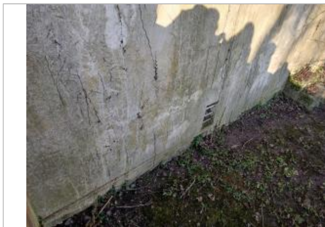
Laisse de crue à 243 cm en dessous du parapet du pont ou 134 cm/sol du pont.

Altitude calculée de l'eau (en m) : 20.76