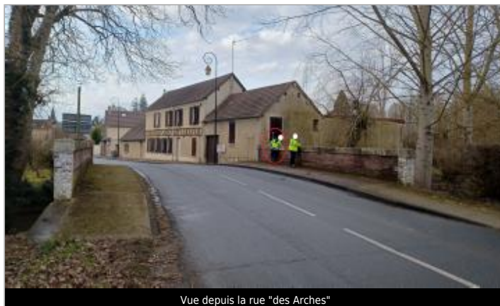
Vue depuis la rue "des Arches"