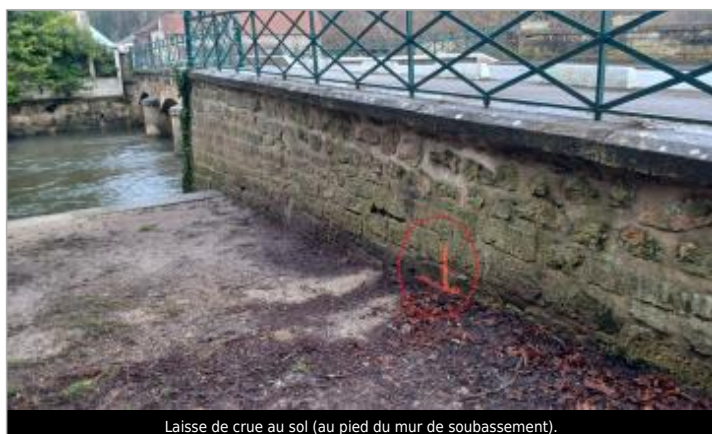
Laisse de crue au sol (au pied du mur de soubassement).

SOURCE DE REPÉRAGE : VISITE DE TERRAIN SPC SACN - 11/03/2020