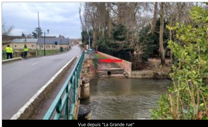
Vue depuis "La Grande rue"