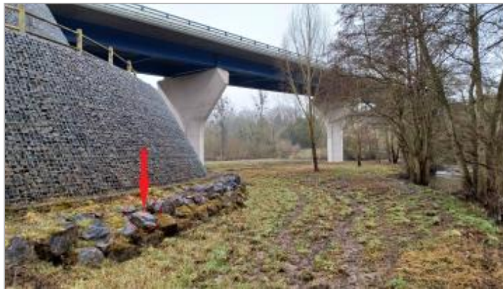
Vue depuis l'amont de la rive gauche.