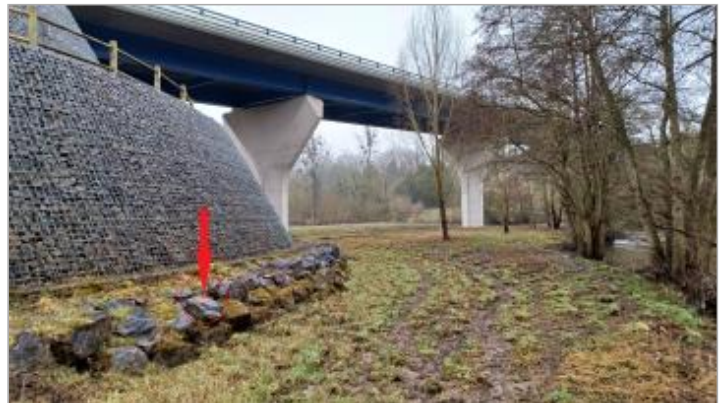
Vue depuis l'amont de la rive gauche.

Coordonnées WGS84 : X: 1.77198352 / Y: 49.29246760