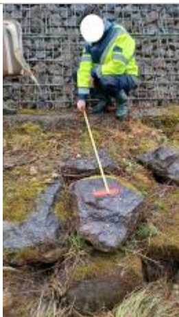
Laisse de crue à 97 cm du haut de l'enrochement.