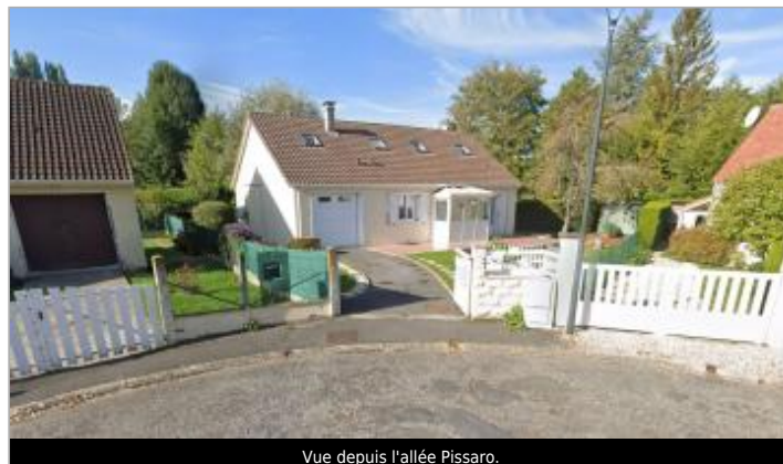
Vue depuis l'allée Pissaro.