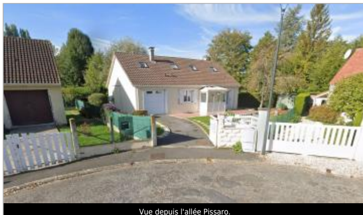
Vue depuis l'allée Pissaro.