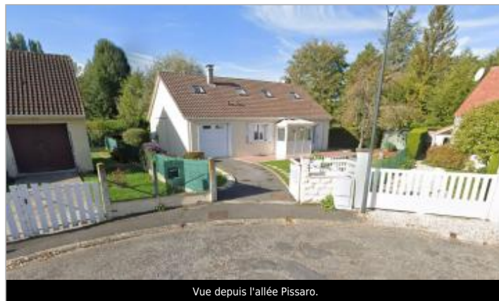
Vue depuis l'allée Pissaro.

GÉOLOCALISATION Coordonnées WGS84 : X: 1.78718041 / Y: 49.28009270 Coordonnées RGF93 (Lambert 93) X: 611737.78 / Y: 6909617.84 Coordonnées RGF93 (ETRS89) : X: 1.7871804 / Y: 49.2800927 Code Hydro: H31-0400 Rive de référence: Gauche