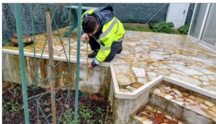
Laisse de crue à 32 cm/haut de la terrasse.

Organisme(s) : SPC Seine aval - Côtiers normands