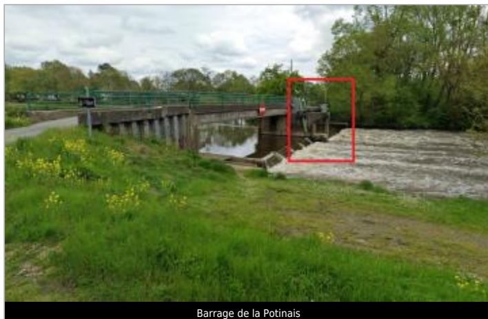
Barrage de la Potinais