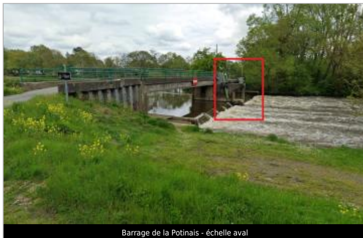
Barrage de la Potinais - échelle aval

Coordonnées WGS84 : X: -2.12273725 / Y: 47.68461180