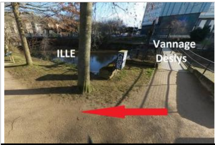
Vannage Deslys amont