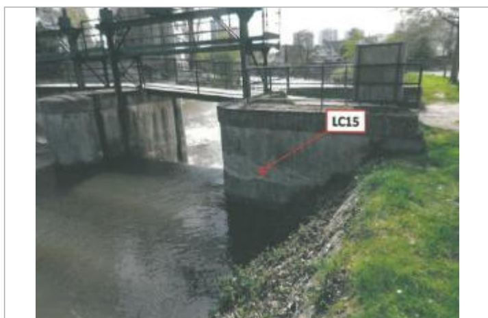
Amont vannage Deslys en 2013

Code : SPC_35238_196_2025 Date de mise à jour : 27/02/2025 Auteur : SPC VCB