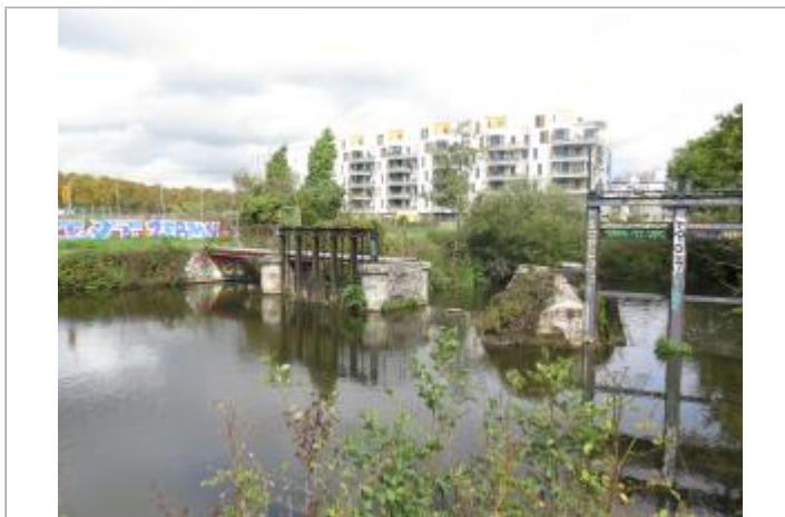
Vannage Trublet en septembre 2017