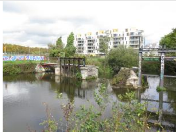
Vannage Trublet en septembre 2017

Coordonnées WGS84 : X: -1.67899019 / Y: 48.12831720