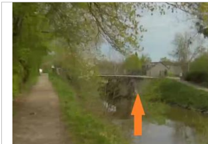
Pont en aval de l'écluse de Robinson à Saint-Grégoire