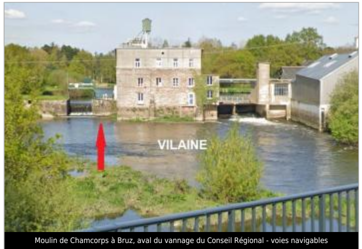
Moulin de Chamcorps à Bruz, aval du vannage du Conseil Régional - voies navigables