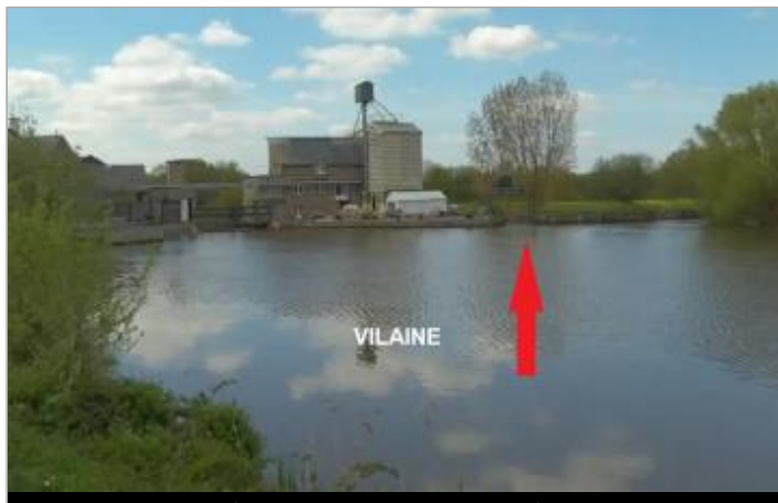
Moulin de Chamcorps à Bruz, amont du vannage du Conseil Régional - voies navigables

Coordonnées WGS84 : X: -1.76116998 / Y: 48.06605010