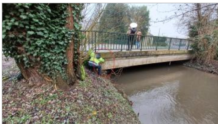
Laisse de crue à 29 cm/bas du tablier du pont.