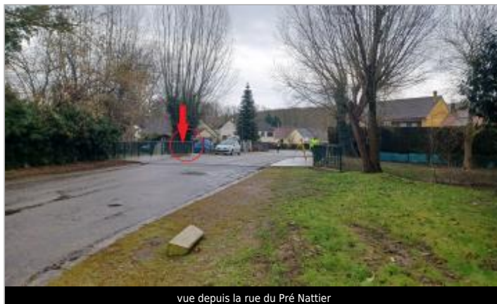
vue depuis la rue du Pré Nattier