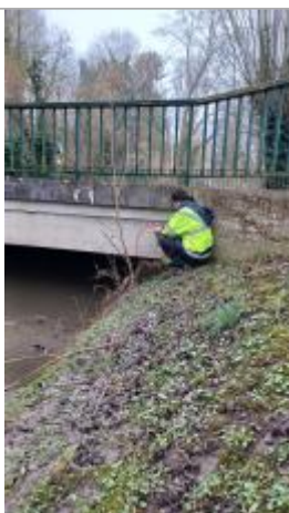
Laisse de crue à 80,5 cm/haut du tablier du pont.