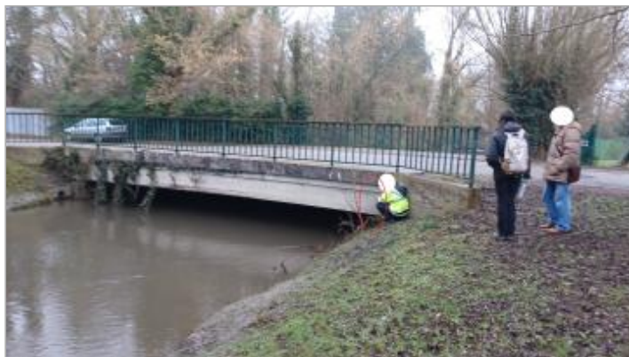
Vue depuis le chemin piéton en aval du pont.

Coordonnées WGS84 : X: 1.78734570 / Y: 49.28055780