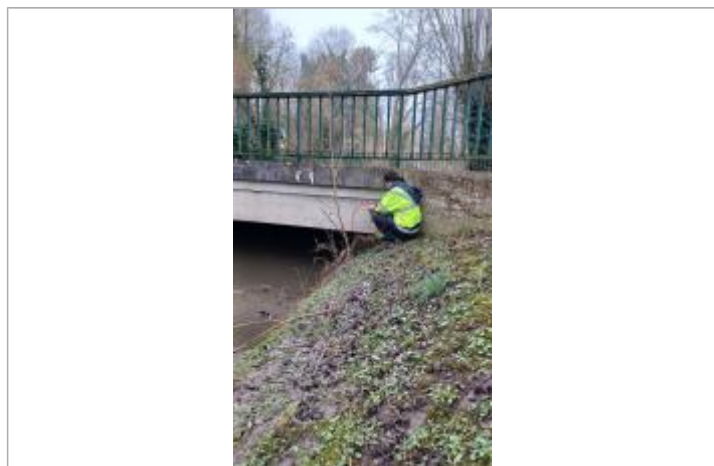
Laisse de crue à 80,5 cm/haut du tablier du pont.

Altitude calculée de l'eau (en m) : 50.42 m