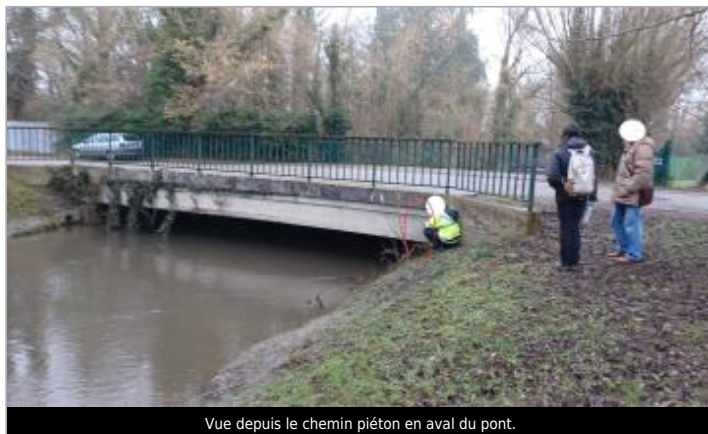
Vue depuis le chemin piéton en aval du pont.