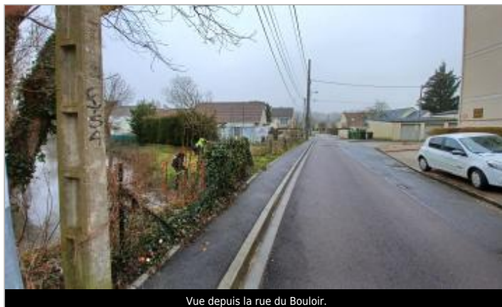
Vue depuis la rue du Bouloir.