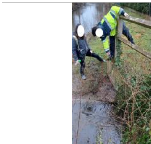
Laisse de crue à 59.5 cm/haut dy tablier de la passerelle.

SOURCE DE REPÉRAGE : VISITE DE TERRAIN SPC SACN - 11/03/2020