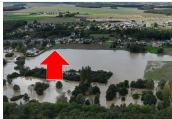
Prise de vue le 10/10/2024 à 16h08