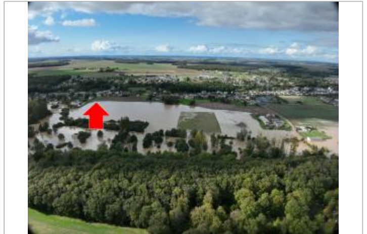
Prise de vue générale