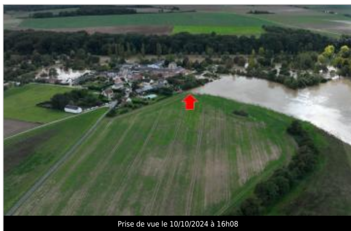
Prise de vue le 10/10/2024 à 16h08