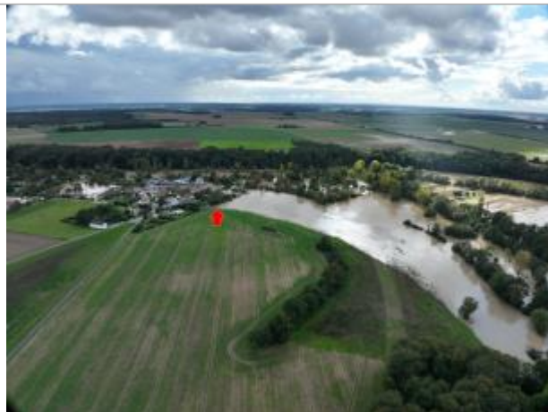
Prise de vue éloignée

Coordonnées WGS84 : X: 1.38123002 / Y: 48.16621930