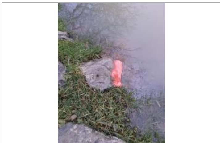
hauteur d'eau au moment du marquage