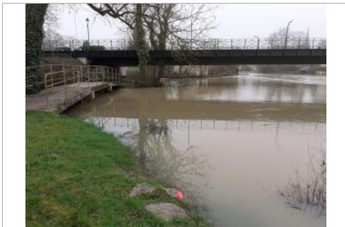
vue d'ensemble du site