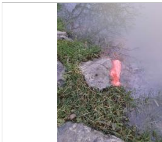
hauteur d'eau au moment du marquage