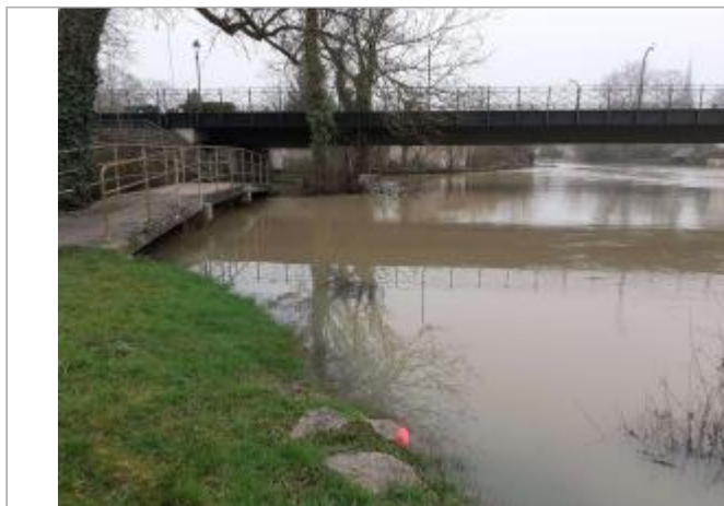
vue d'ensemble du site