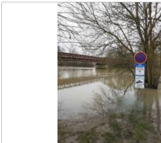
cale de mise à l'eau du port

Coordonnées WGS84 : X: 0.22770000 / Y: 47.63730000