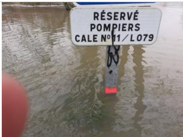
marque de la hauteur d'eau lors de la visite

NIVELLEMENT RÉALISÉ PAR LE SPC MAINE LOIRE AVAL. - 13/03/2025