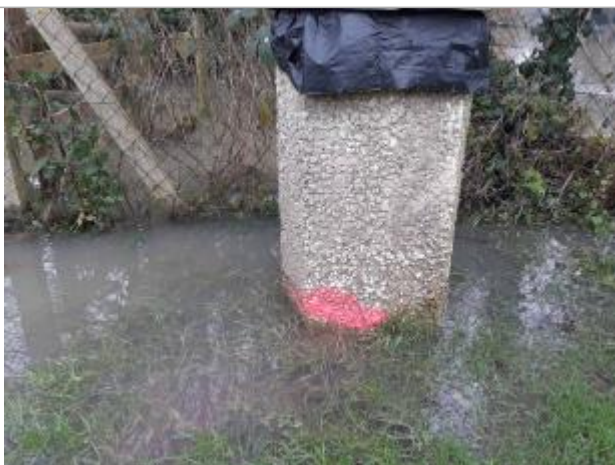
marque sur poubelle béton