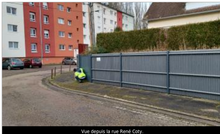
Vue depuis la rue René Coty.