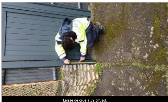
Laisse de crue à 39 cm/sol.