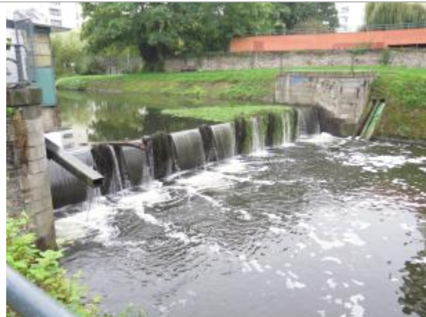
Aval maçonnerie du clapet du cabinet vert

Coordonnées WGS84 : X: -1.66423542 / Y: 48.10806690