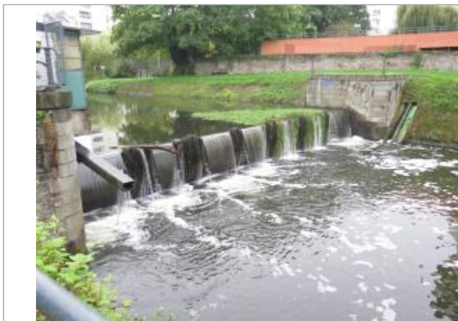
Aval maçonnerie du clapet du cabinet vert