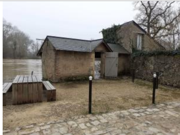
lavoir de Bazouges