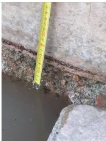
marque présente sur mur environ 7,5 cm au-dessus du niveau de l'eau.