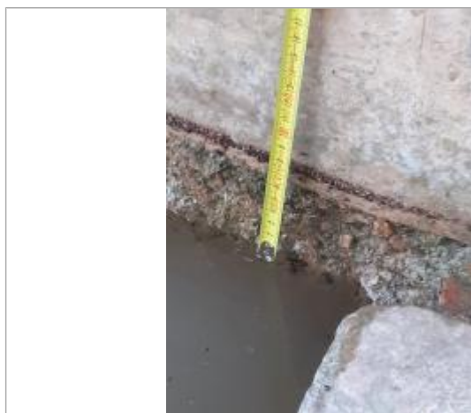
marque présente sur mur environ 7,5 cm au-dessus du niveau de l'eau.