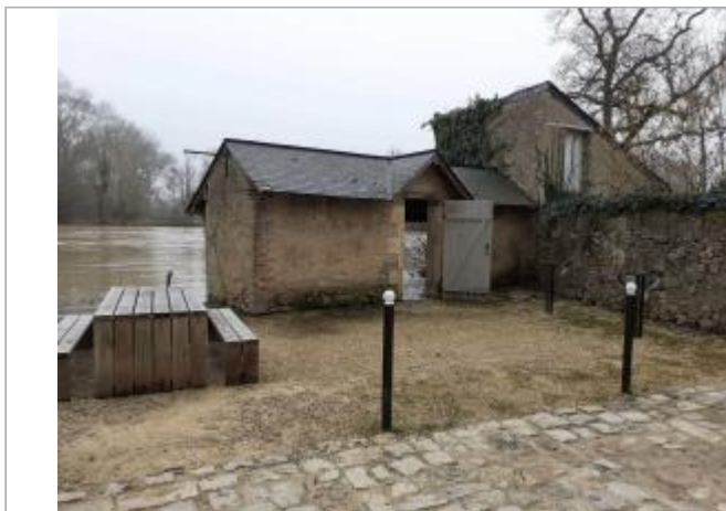
lavoir de Bazouges

Coordonnées WGS84 : X: -0.16790000 / Y: 47.68780000