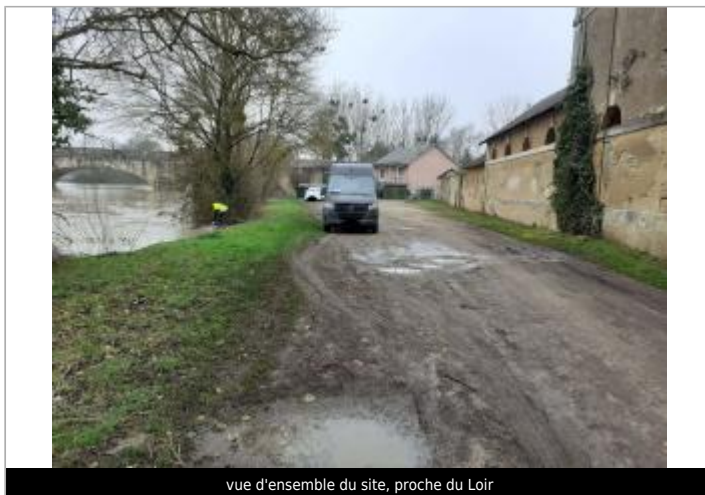
vue d'ensemble du site, proche du Loir

GÉOLOCALISATION Coordonnées WGS84 : X: -0.08910900 / Y: 47.69576500 Coordonnées RGF93 (Lambert 93) X: 468352.16 / Y: 6737351.28 Coordonnées RGF93 (ETRS89) : X: -0.089109 / Y: 47.695765 Code Hydro: M1--0160 Rive de référence: