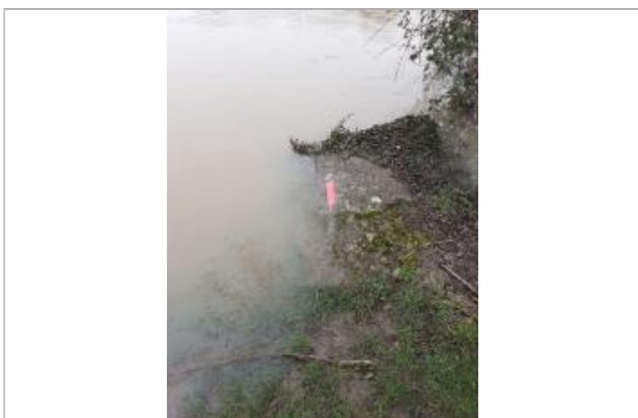
Marque sur support dur, niveau de l'eau à la date du repère.

MARQUE Maximum de l'inondation : Non Visibilité : Oui