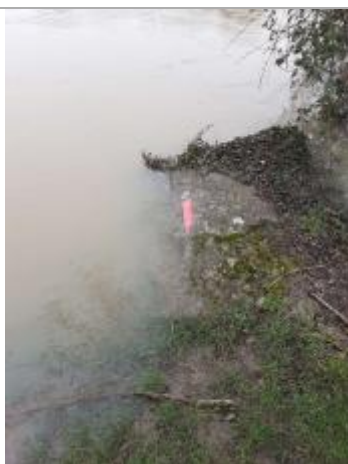
Marque sur support dur, niveau de l'eau à la date du repère.