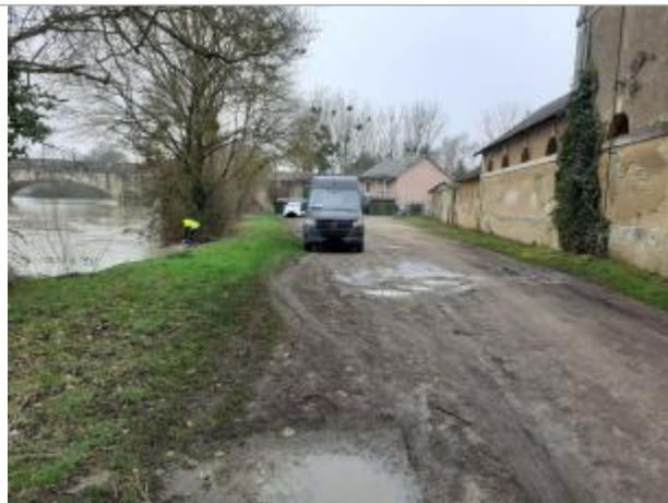
vue d'ensemble du site, proche du Loir

Coordonnées WGS84 : X: -0.08910900 / Y: 47.69576500