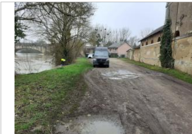
vue d'ensemble du site, proche du Loir