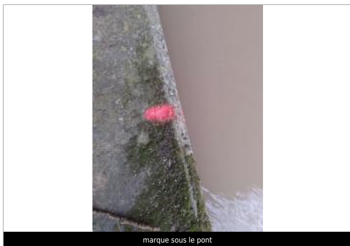
marque sous le pont