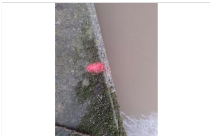
marque sous le pont