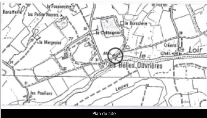
Plan du site

GÉOLOCALISATION Coordonnées WGS84 : X: -0.02559375 / Y: 47.70223010 Coordonnées RGF93 (Lambert 93) X: 473140.24 / Y: 6737884.63 Coordonnées RGF93 (ETRS89) : X: -0.0255938 / Y: 47.7022301 Code Hydro: M1--0160 Rive de référence: