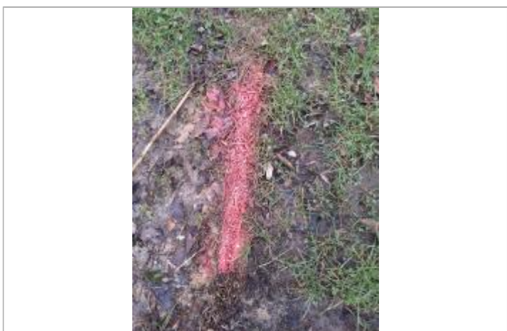
Marque de peinture au niveau d'une laisse de crue au sol (débris végétaux).

MARQUE Maximum de l'inondation : Oui Visibilité : Oui