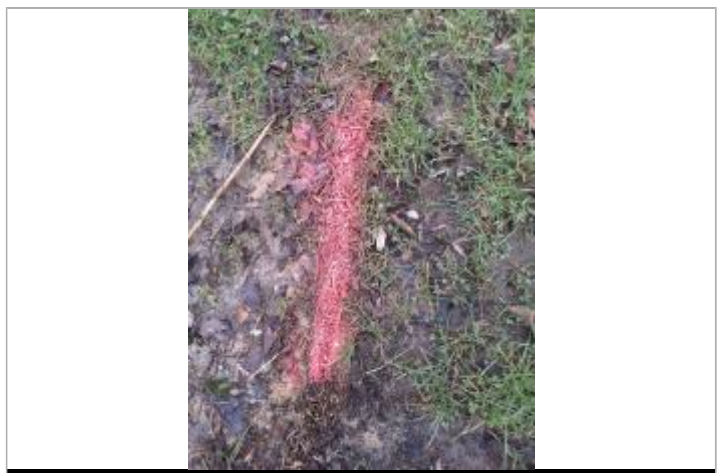
Marque de peinture au niveau d'une laisse de crue au sol (débris végétaux).

MARQUE Maximum de l'inondation : Oui Visibilité : Oui