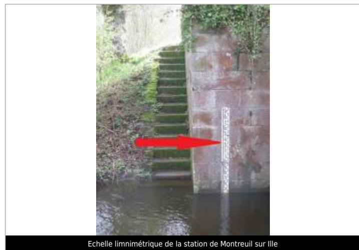
Echelle limnimétrique de la station de Montreuil sur Ille

GÉNÉRAL Code : SPC_35195_02_2025 Date de mise à jour : 10/04/2025 Auteur : SPC VCB