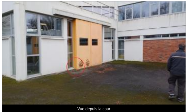
Vue depuis la cour