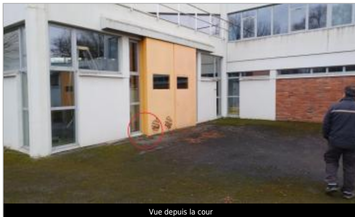
Vue depuis la cour