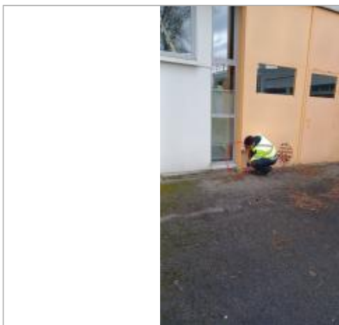
Laisse de crue à 6 cm/sol.